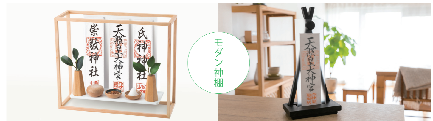
現代のインテリアに馴染むシンプルなデザインの神棚です。