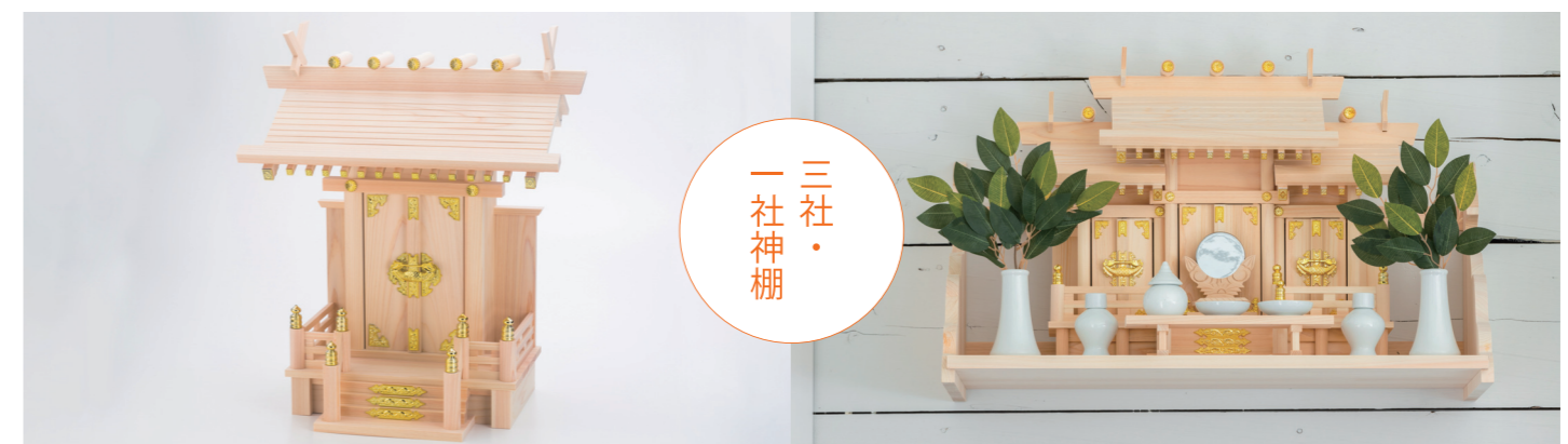
古くから親しまれてきた宮形の神棚です。

神棚とは、家の中で神さまをおまつりする場所のことです。また、神棚に据えられる、神社の建物をかたどったものを「宮形」といいます。神棚は、三社・一社造りの宮形の中にお神札を納めておまつりするのが伝統的な形式ですが、現代の生活様式に合わせてデザインされた、宮形を用いない「モダン神棚」や少ないスペースでもおまつりできる卓上型の神棚やお神札立てなどもあります。日頃の感謝の気持ちを伝え、神さまに手を合わせる時間を作りませんか？