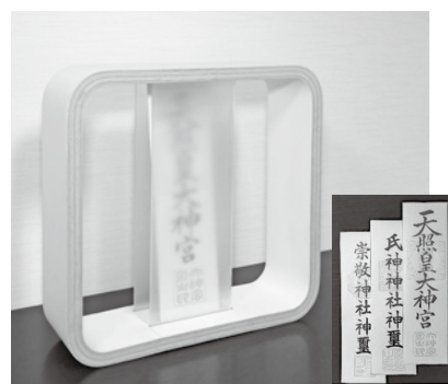
据え置きタイプ(いのり30I)