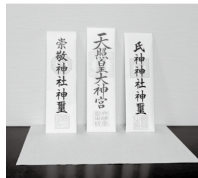
半紙を敷いたもの