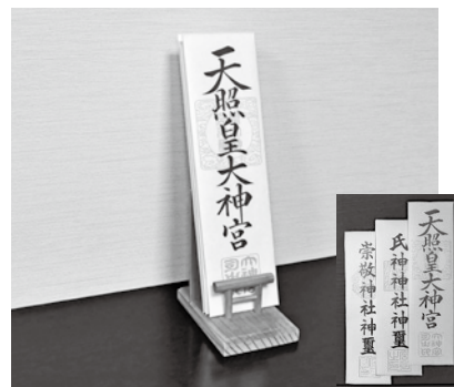
鳥居付おふだ立て