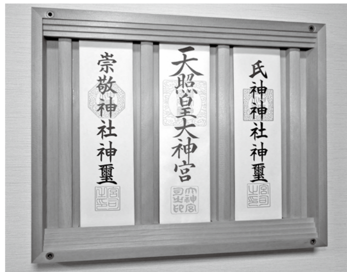
壁掛けタイプ(いのり50I)