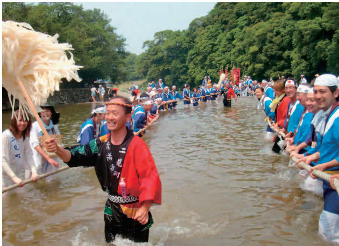
お白石持行事 内宮川曳 7月26日

発行 埼玉県神社庁 さいたま市大宮区高鼻町1-407 電話048(643)3542 編集 庁報室 印刷 株式会社アサヒコミュニケーションズ